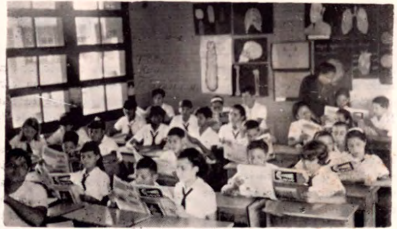
Los alumnos de la Escuela Central de Tilarán leen con gusto nuestra Revista.